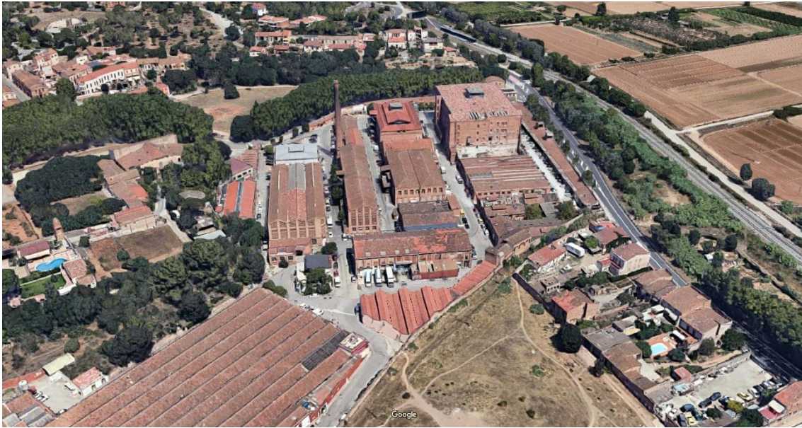
Vista des de sud de la Colònia Güell (Google Maps, 2019)