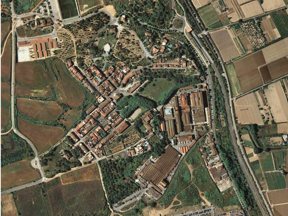
Vista aèria de la Colònia Güell

Fins la dècada de 1960, la Colònia va mantenir la producció industrial i la personalitat del nucli urbà, ben diferenciat del poble de Santa Coloma de Cervelló, que va créixer fins superar en població a la Colònia. La fàbrica va tancar el 1973 degut a la crisi del sector tèxtil , coincidint amb la crisi del petroli a nivell mundial. Aquest fet va produir un fort impacte social a la Colònia. En els anys posteriors, la propietat es va anar venent: la fàbrica en fraccions a empreses diverses, les cases als seus habitants, i els equipaments i terrenys de l'entorn a institucions públiques.