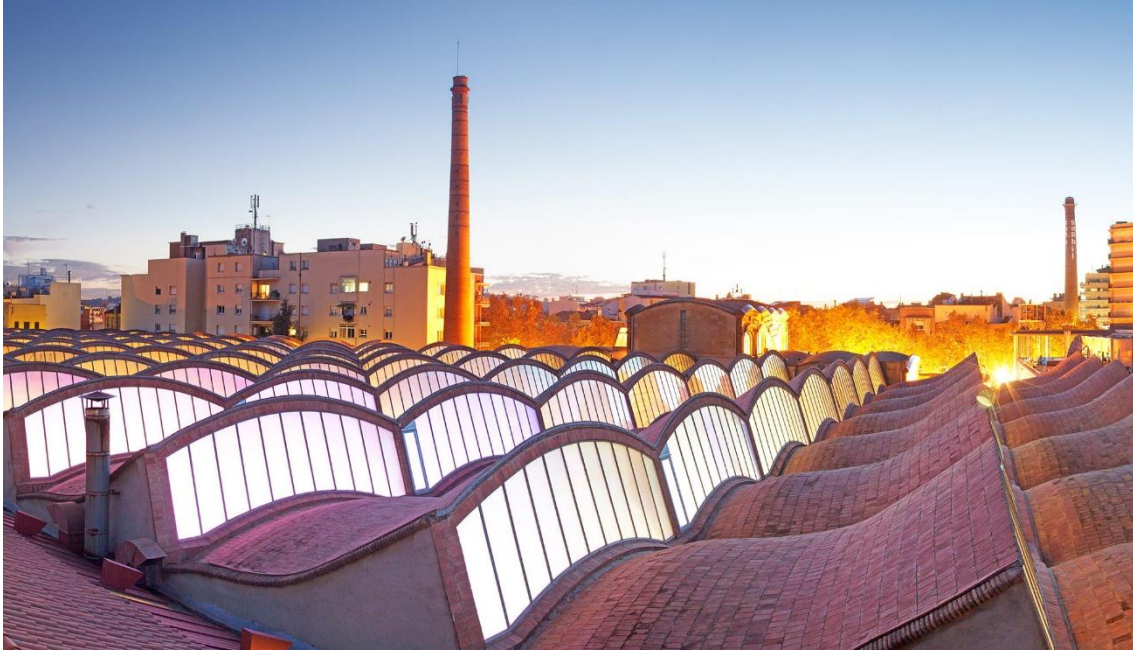
Fàbrica modernista Vapor Aymeric, Amat i Jover a Terrassa, actualment Museu Nacional de la Ciència i la Tècnica de Catalunya

Des de la seva implantació a mitjans del segle XIX, les colònies industrials de Catalunya , van suposar una revolució industrial i social. La gran majoria es van situar en zones rurals formant un nou nucli a partir de la fàbrica. A la segona meitat del segle XIX es van aixecar 72 colònies industrials concentrades al voltant dels grans rius de Catalunya, especialment el Ter i el Llobregat i dels seus afluents més cabalosos. Les colònies industrials es van desenvolupar en moltes zones d'Europa occidental des de mitjan segle XIX, però a Catalunya destaquen pel seu elevat nombre. El que buscaven aquestes ubicacions al costat del riu era aprofitar l'energia hidràulica necessària per moure els telers en uns terrenys barats.