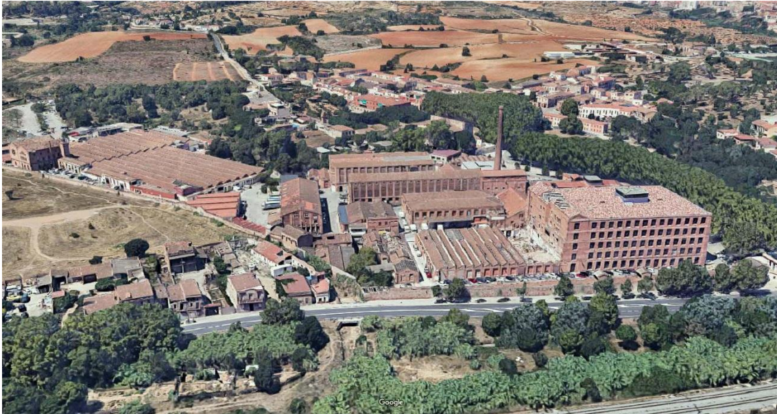
Vista des d l'est de la Colònia Güell

Es tracta d'un curs d'intervenció, conservació i transformació del patrimoni construït, en aquest cas industrial. Per tant, l'objectiu no és rehabilitar, ni restaurar. L'exercici consisteix en la intervenció i transformació d'un edifici del recinte industrial , un cop analitzat el conjunt i la seva relació amb l'entorn, format per la resta de la colònia, Santa Coloma de Cervelló, el paisatge agrari i les infraestructures.