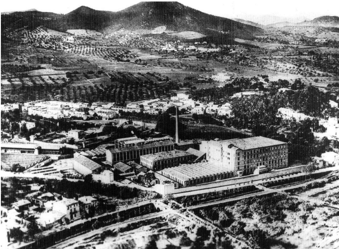
Vista de la Colònia Güell, principis segle XX (Colònia Güell, 2002, p25)

La Colònia Güell es va començar a formar el 1890 , per iniciativa de l'empresari Eusebi Güell a la seva finca Can Soler de la Torre, situada en el terme municipal de Santa Coloma de Cervelló. Allà va traslladar la indústria tèxtil que tenia a Barcelona, al barri de Sants. L'interès d'allunyar-se dels conflictes socials presents a la ciutat, va provocar que la nova indústria es plantegés establir com una colònia industrial; amb les cases dels obrers al costat de la fàbrica, integrades en la mateixa propietat, formant un nucli urbà amb personalitat pròpia i amb la seva vida social i econòmica tutelada per l'empresa.